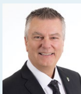
BENOIT BOUCHARD MAIRE